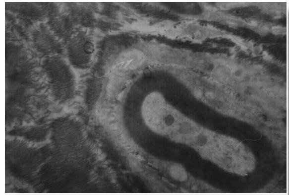
Рис. 3. Неушкоджене мієлінізоване нервово волокно. Ендоневрій. Пучки колагенових волокон. Дистальний відрізок периферійного нерва щура. 6 тижнів після віддаленної нейрорафії та за умов застосування церебралізіну. Електронна мікрофотографія. \times 18000 .

новоутворені волокна не зустрічались. В ендотеліоцитів виявлялась помірна кількість колагенових та еластичних волокон. У цитоплазмі макрофагів ендоневрію спостерігались ліпідні гранули. Кількість інтраневральних судин при цьому збільшувалась, і вони були менш розширені.