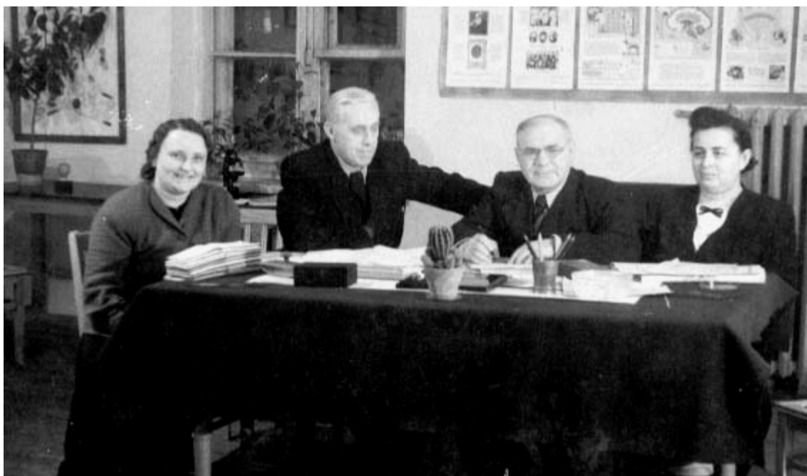
Професор М.І.Зазибін та спіробітники кафедри планують черговий фрагмент науково-дослідної роботи, пов'язаної з аналізом ролі периферичних нервів у процесі регенерації органів (1951 рік).

На підставі багаторічних спостережень М.І.Зазибіна, підкріплених дослідженнями співробітників, було встановлено, що явища регенерації органів, а в переважній більшості випадків і дегенерації, завжди починається з нервового компонента, стан якого і визначає напрямок цього процесу. Таким чином, ряд патофізіологічних узагальнень отримав у дослідженнях кафедри детальну морфологічну розшифровку. Низка нових даних і закономірностей, установлених М.І.Зазибіним, увійшла у багато вітчизняних і іноземних посібників.