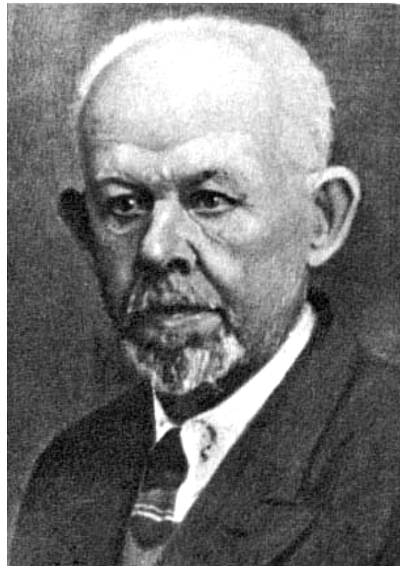
Професор В.П.Карпов – засновник кафедри гістології, перший ректор Катеринославської медичної академії.

лись методи прижиттєвого дослідження клітинних ядер. Він створив оригінальний мікромом власної конструкції, вивчав та розвивав методи прижиттєвого дослідження клітин. Цей напрямок Катеринославської гістологічної школи згодом отримав успішний розвиток у відомих роботах професорів Д.М.Насонова, В.Я.Александрова, В.П.Макарова.