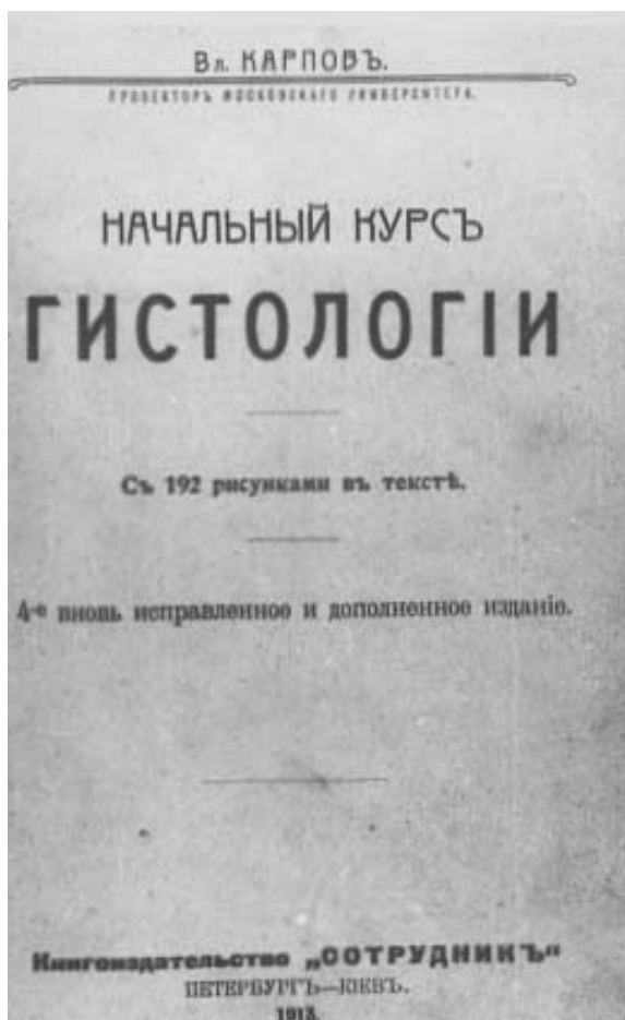
Титульний аркуш підручника "Начальный курс гистологии», створений В.П.Карповим у 1913 році.

В.П.Карповим перекладено з древньогрецької ряд творів Аристотеля та Гіппократа. Їм здійснена редакція, написані вступні статті та замітки до "Вибраних книг Гіппократа". Ця книга й донині є кращим російськомовним виданням Гіппократа. Лекційний курс В.П.Карпова відрізнявся високим науковим рівнем, філософською глибиною та блискучим викладенням. Під його керівництвом пройшов II Національний з'їзд анатомів, гістологів та ембріологів. Будучи вченим з колосальною ерудицією, він організував і редагував "Катеринославський медичний журнал", який функціонував з 1921 до 1941 року.